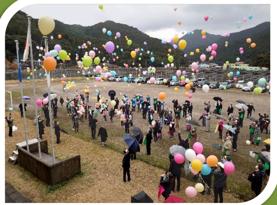
今里小学校閉校記念風船飛ばし式 (令和5年2月26日実施)