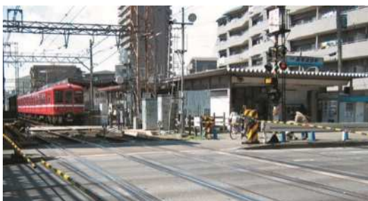
旧 産業道路駅（現 大師橋駅） （平成20年頃撮影）