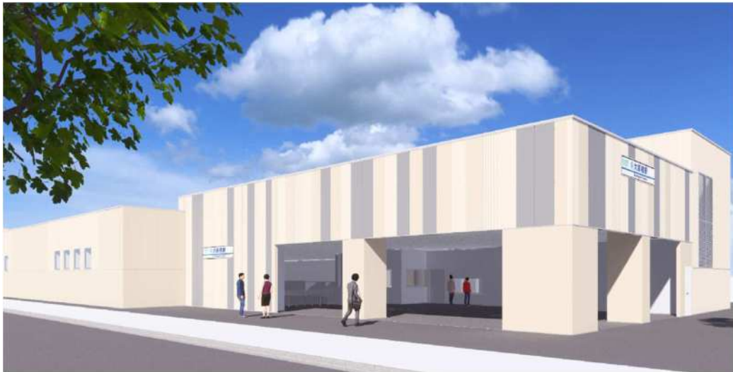
大師橋駅駅舎完成イメージ