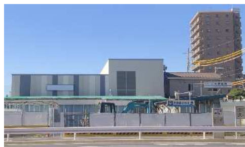
現在の大師橋駅 （令和5年12月8日撮影）