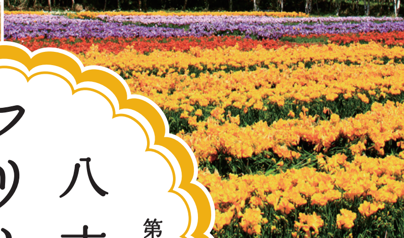
八形山フリージア畑