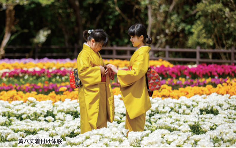
黄八丈着付け体験