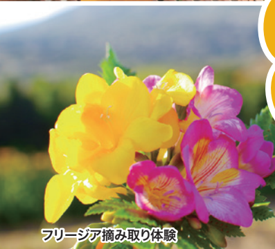
フリージア摘み取り体験