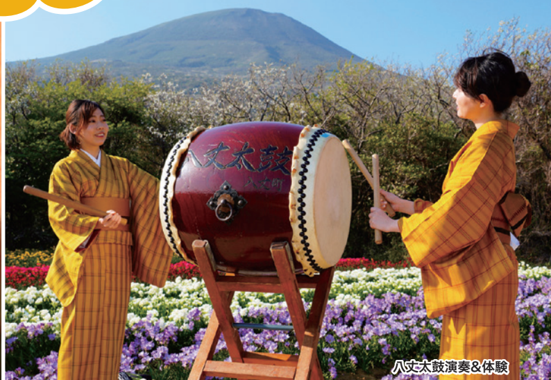
八丈太鼓演奏&体験