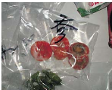
廃棄部を採取している。