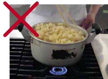
切ってゆでている。また油揚げの量に比べ、湯の量が少なすぎる。