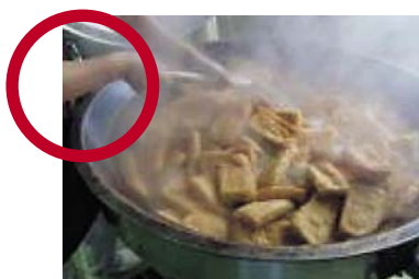
多めの熱湯で、切らずにゆでる。

また、生揚げは、調味料が浸透しにくいので、煮物に入れる場合は、薄味で別途煮て下味を付けておきます。