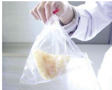
テープで巻いただけで、密封されていない。