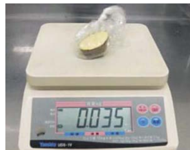
50g程度採取されていない。