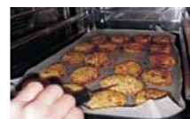
スチコンのオープンモードで焼く→ヒレカツのでき上がり