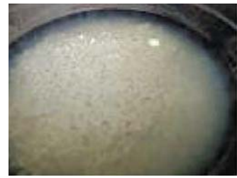
豆腐は小さめに切り、水からゆでておく。