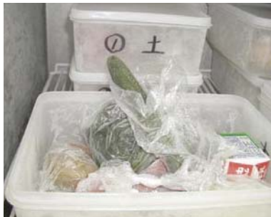
密封されていない。

レトルト食品（レトルトパウチ食品）は、気密性及び遮光性を有する容器で密封し、加圧加熱殺菌した食品ですので、保存食をとる必要はありません。