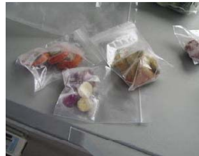
ジッパー付きの袋を使用しているが、密封されていない。