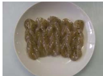
表面積を広くすると、調味料の浸透がよくなります。