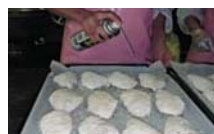
オイルスプレーで油を吹きつける