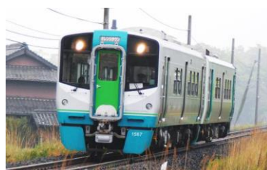
新型ローカル気動車（イメージ）