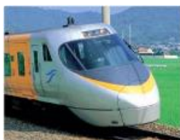
リニューアル対象電車（8000系）