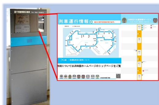
サイネージの設置（例）