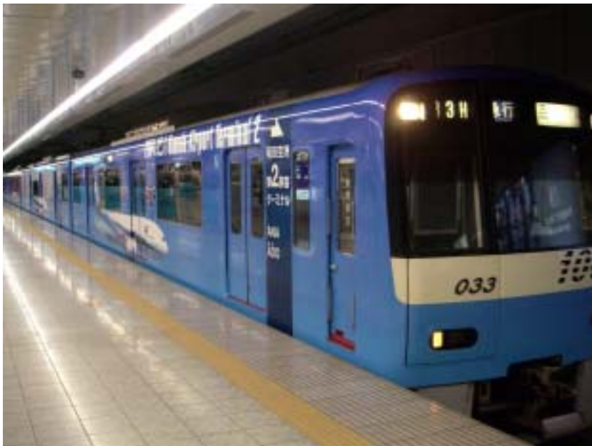
（京急線・羽田空港駅に停車するPR電車）