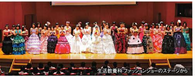
生活教養科ファッションショーのステージから

宮の原中・男子生徒(普通科数学)を体験 大ホールと教育会館の自習室に感動。数学の授業はパソコンを使用して、とてもわかりやすかった。中学にはないインターアクトクラブなどの部活動に興味を持った。