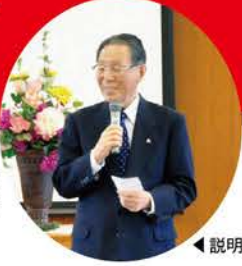
▲説明をなさる本校校長

平成23年度高校入試説明会開かれる 平成23年度の高校入試説明会が、9月16日(木)午前9時30分から本校の須賀栄子記念講堂をメイン会場として行われ、県内外の各中学校から進路指導主事や第3学年主任・3年担任など120名を超える先生方が参加され、熱心な質疑応答がくりひろげられました。