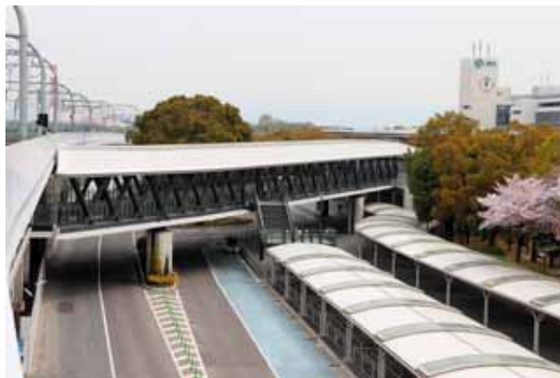
淀駅(左)と京都競馬場(右)の入場門「ステーションゲート」を直結する専用通路