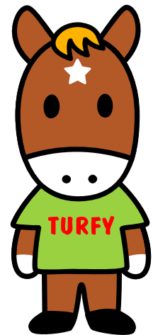
ターフィー君 © 2003 SANRIO CO., LTD.

なお、5月20日(金)14時頃より、京阪電車天満橋駅にポニー駅長が1日駅長として登場、また京都競馬場の人気キャラクターであるターフィー君たちも応援に駆けつけ、上記イベントを大々的にアピールします。