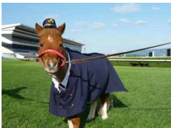
ポニー駅長(イメージ)