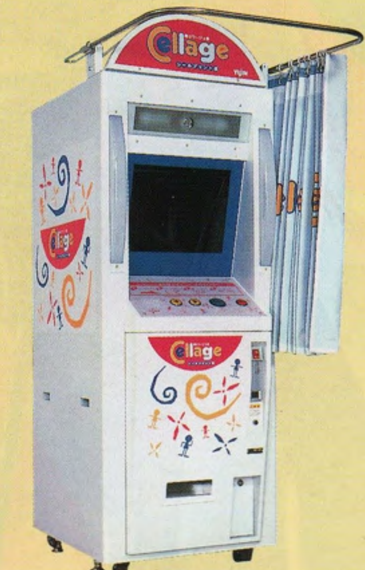
セラージュ ユージン製