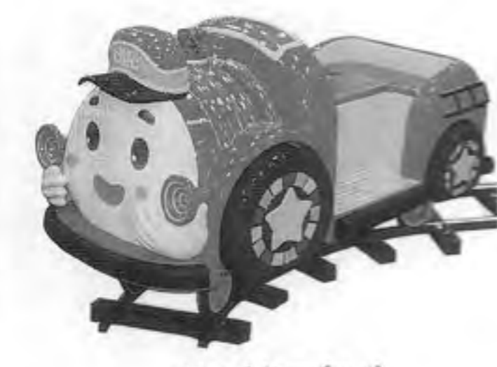
ファイヤーポツポ

理想像探偵社」が十一月下旬に、 またまた設置型乗物機 「わんぱくフィッシング」 が十二月下旬にそれぞれ 発売となった。 「理想像探偵社」は プレイヤーの性格を心理テ ストにより分析し、その 結果を人相学に置き換へ て理想の相手の顔をCG で作出すというもの。 心理テストで九問(二 択制)に答える。診断 結果を「調査報告書」と してプリントアウト。こ の「報告書」には診断結 果による理想の相手の顔 CGとともに、プレイヤー が先に選んだ好みの相 手の顔CGも印刷され、 手