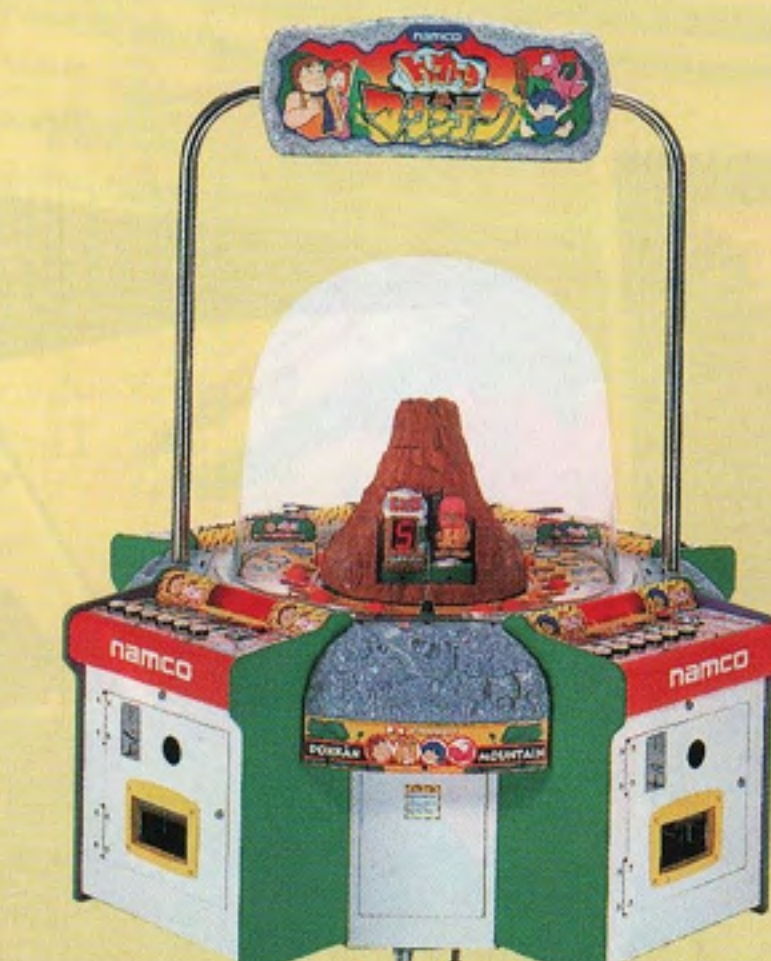
ドッカーンマウンテン