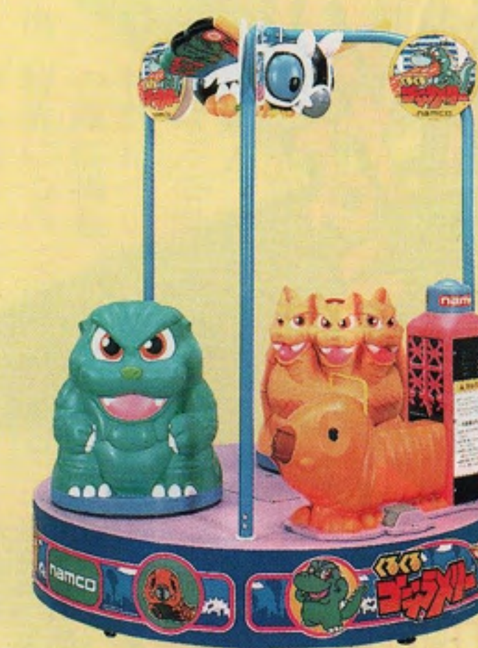
くるくるゴジラメリー