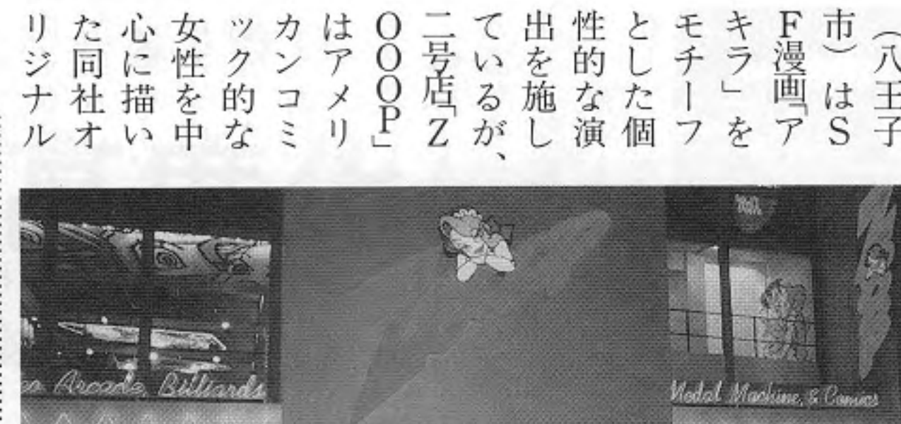
仙台駅前のパブリックス「ZOOPP」を外側から見た入口付近

消費税引き上げが迫るなかAM業界では、平均するが前年比一割ぐらゐの落ち込みが見られるとも言われている。確かにブレイヤー層の構造変化による影響も大きい。業界側の努力がどれほど果されているか、という観点で業界の置かれている状況を総合的に分析したい。聞きこえによる、はつきりした原因はつかめない。これは香港当局はこれらゲーム機に対する取り組みの基盤であると思う。例えば先ほどジェトロとJAMMA共催による