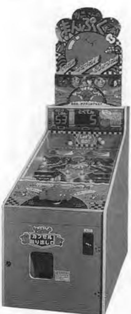
カニさんのまんぶくだあ

真砂工業(株)本社千葉、 をデザインしたハンドル ライズマシン「カニさん のまんぶくだあ」が十 月下旬以降発売となる これは次々に転がって くる食物をカニに食べさ せるというコミカルなゲ ーム。プレイヤーはカニ サミの閉閉を繰り返すの