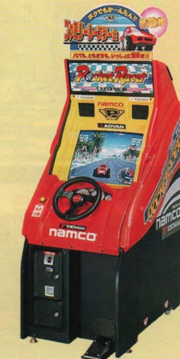
ポケットレーサー