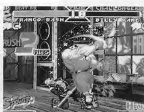
リアルバウト餓狼伝説スペシャル