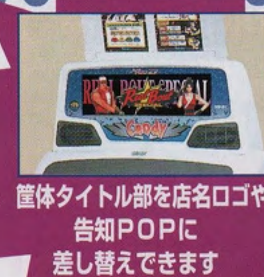
筐体タイトル部を店名ロゴや告知POPに差し替えます