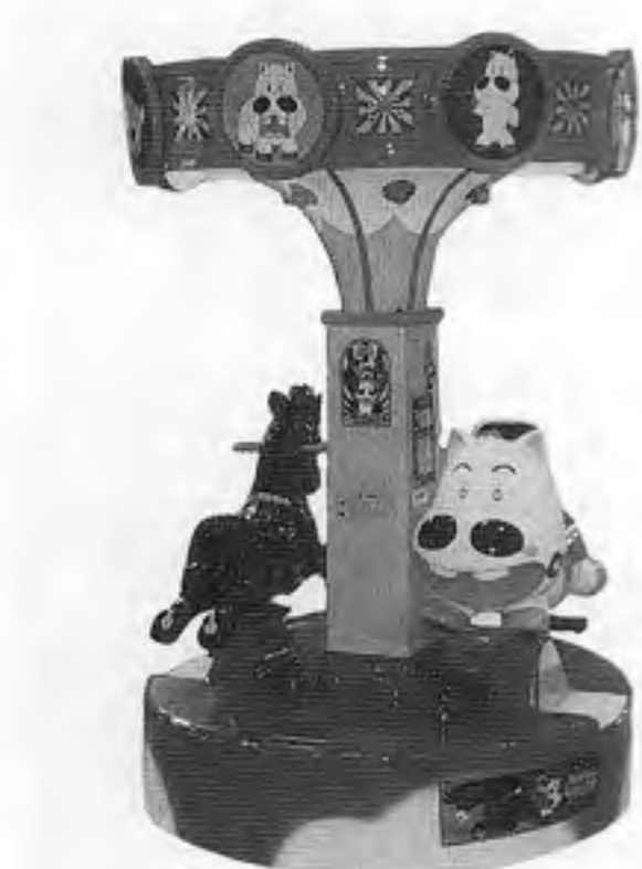
くるりんらんど・みどりのマキバオ

で、大量の玉をキャッチ い出される。なお景品を 払い出す、リプレイに ゲームはタイマー制で 制限時間内に一定数以上 の玉をキャッチすると景 品カプセル(百)が、私 格三十九万八千円。