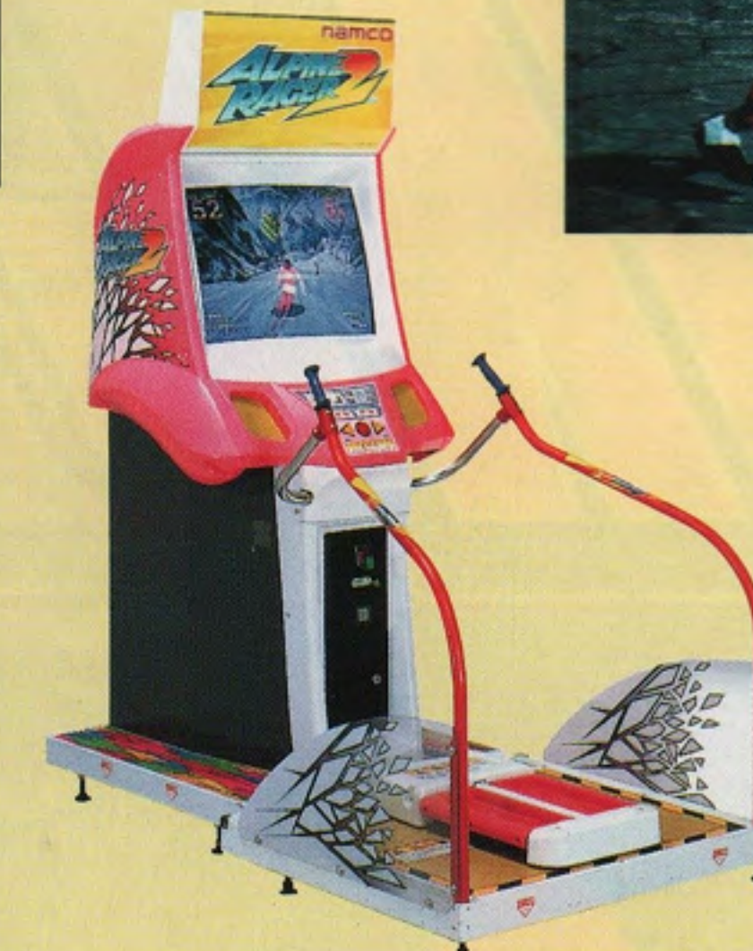
アルペンレーサー2 コンパクト