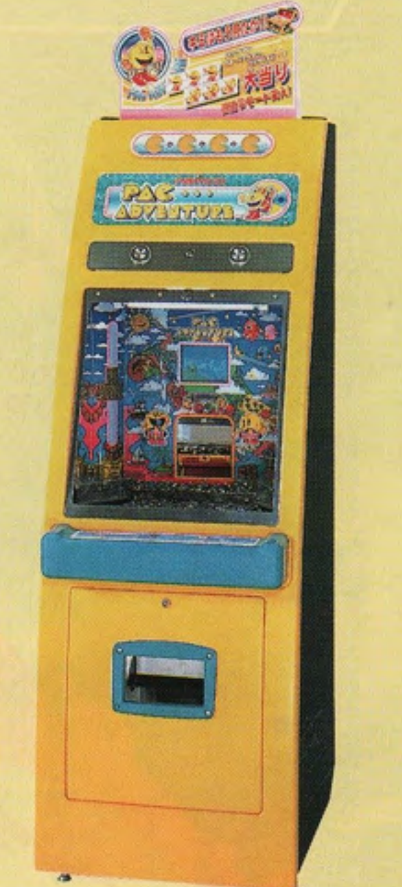
バック アドベンチャー