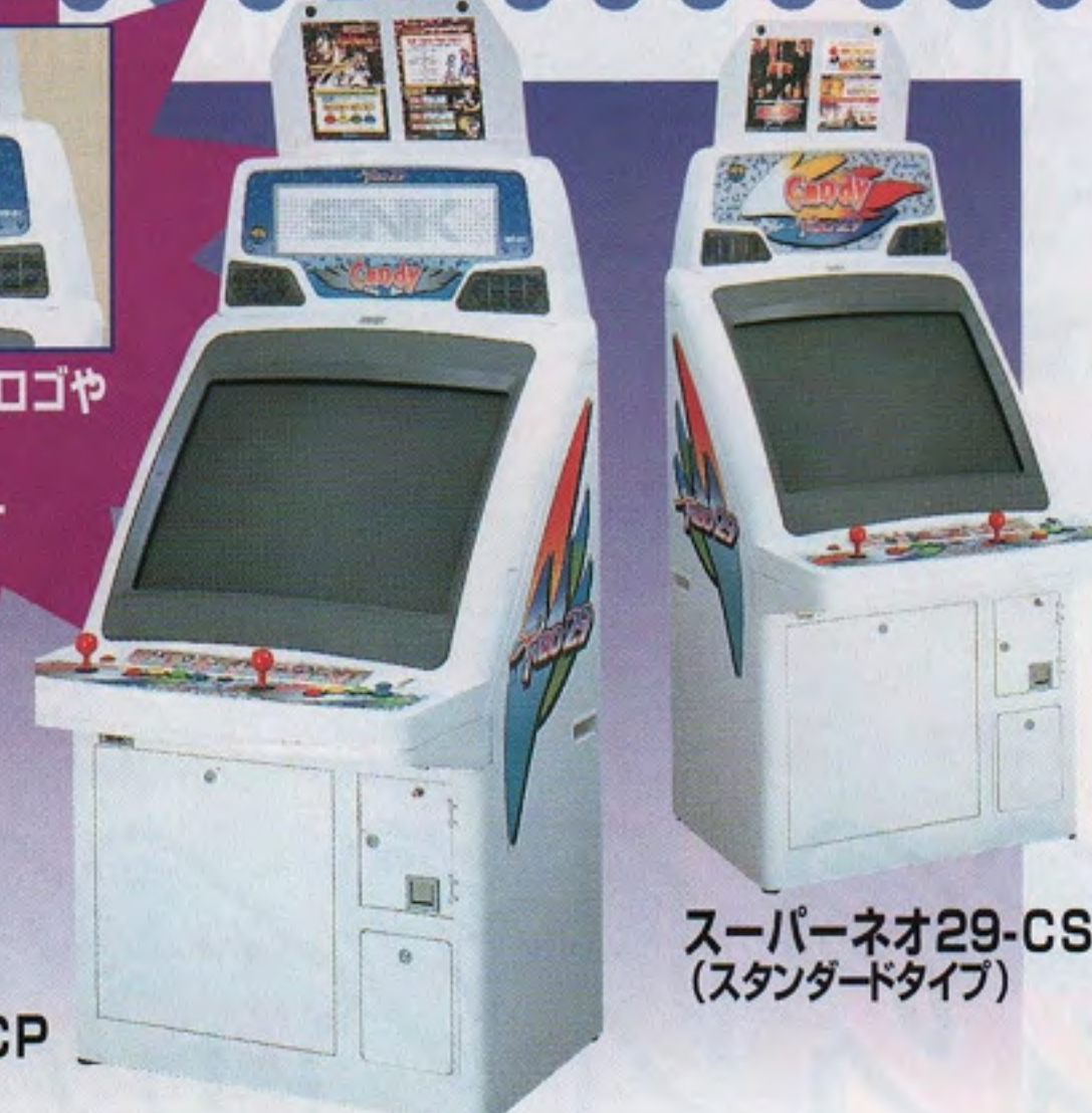
スーパーネオ29-CS (スタンダードタイプ)