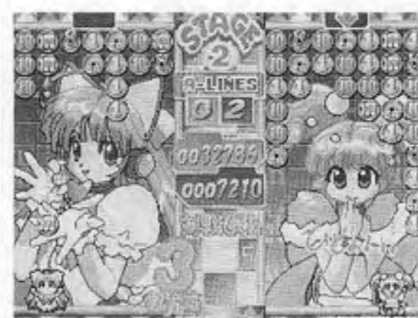
マネーアイドル・エクステンション

フェイス(株)本社東京、 金谷龍平社長)から、「ネ オジオMVS」用の落ち 物パズルゲーム「マネー アイドル・エクステン ション」が、一月十七日 発売となった。 これは同社初の「ネ オジオ」ソフトで、上から 落下してくる六種類の硬貨 を組み合わせ、高額の硬貨 へと両替していくという もの。 プレイヤーで画面下のキ ャラを操作して取りたい硬 貨の下まで移動させ、A ボタンを押すとその硬貨