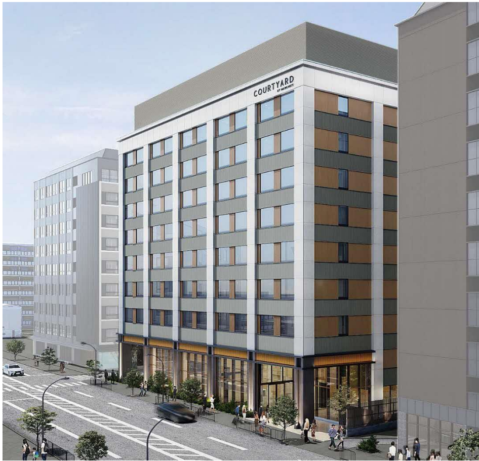
外観イメージ（全景）