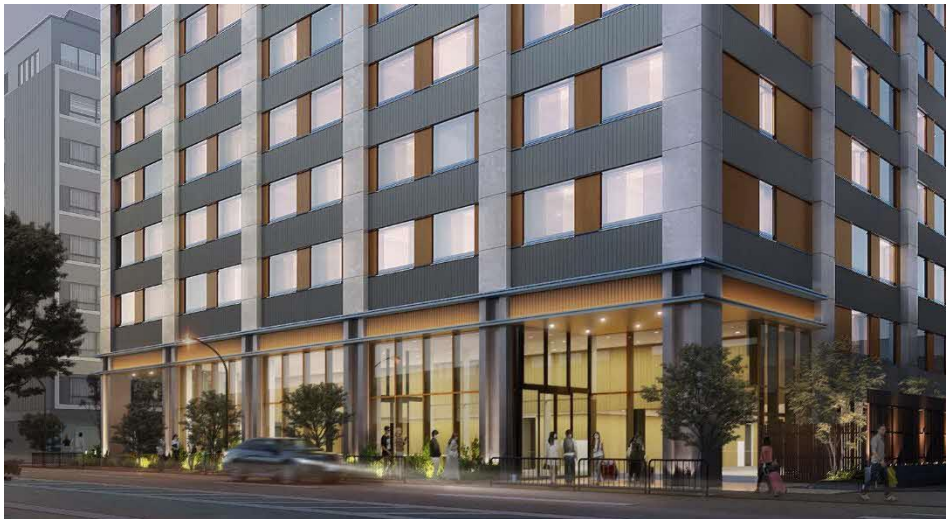
外観イメージ（エントランス付近）