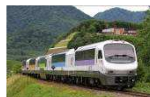
「まんぷくサロベツ号」に使用するノースレインボー車両