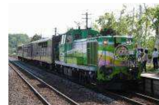
富良野・美瑛ノロッコ号