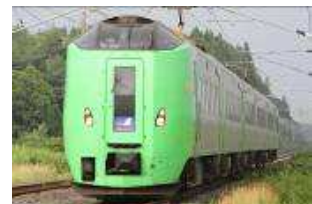
「スーパー白鳥」に使用する789系特急電車

※運転日：○印(白鳥71～74号運転および74・95・96号新青森～弘前間延長運転)