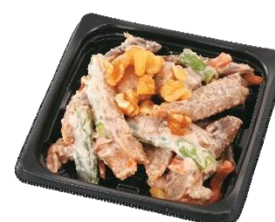
皮付きごぼうのくるみ和え

西武池袋「リトルシェフ」開発メインベンダー様をはじめ、ヨークと各メーカー様とのオリジナル共同開発商品。使用食材・見栄えにこだわった商品です。