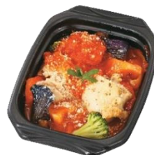
グリルチキンと5種野菜のトマト煮