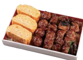
店内焼き紅雫の だし巻き玉子入り焼鳥重

オリジナル指定農場生産『紅雫たまご』を使い店内で1つ1つ丁寧に焼いた『紅雫だし巻玉子』を盛り込んだお弁当を多数取り揃えました。