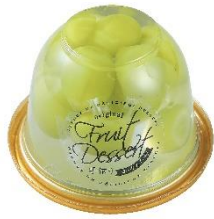
シャインマスカットの とろけるジュレ