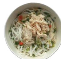
あっさり味の 鶏肉のフォー