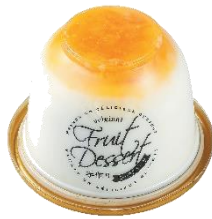
早味かんの たっぷり杏仁豆腐