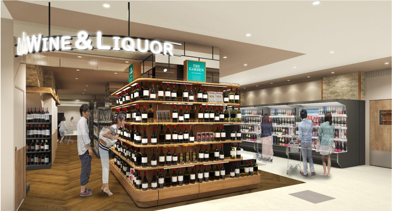
【シェルガーデンのバイヤーセレクト商品（一例）】

輸入商材の調達に強みを持っているシェルガーデンのバイヤーセレクト商品を中心に約1,260点のお酒を品揃えいたします。専任スタッフが毎日のお食事に合うデイリーワインをご紹介します。