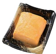
店内焼き紅雫の だし巻き玉子