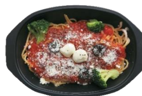
モッツアレラとブロッコリーの トマトソース