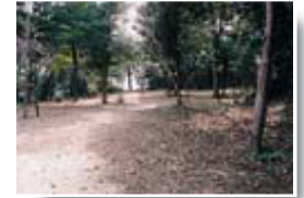
平成15年度緊急地域雇用創出特別基金事業 事業費12,000千円 事業面積12,127㎡

市は美々津町にある「白山ふれあい広場」を整備しました。白山は、美々津小学校の西側にある緑に囲まれた小高い山です。3か所ある入り口から散策道を歩いて行く中ほどに「ふれあい広場」があります。維持管理は、地元の白山管理運営委員会が行います。（広場面積2,800㎡・散策道総延長380m、幅員1m）