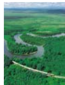
釧路湿原の中を走る 「くしろ湿原ノロッコ号」