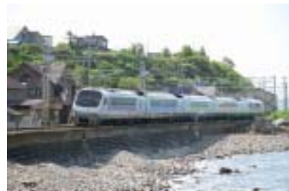
「さくらエクスプレス」に使用するノースレインボー車両