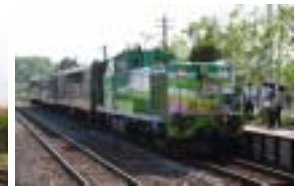
富良野・美瑛ノロッコ号