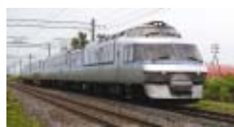
フラノラベンダーエクスプレス