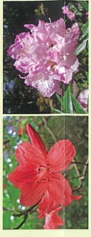
アマギシャクナゲ

天城山を中心に広がる広大な森林には、ブナをはじめ、ヒメシャラ、カエデ、アマギシャクナゲ、アマギツツジ、トウゴクミツバツツジ、アセビ、マメザクラなどが混生しています。稜線部にはブナの巨木や美しいブナ林が見られます。5月中旬～下旬にはアマギシャクナゲ、また、6月下旬～7月上旬には天城固有種のアマギツツジが咲き、多くのハイカーで賑わいます。