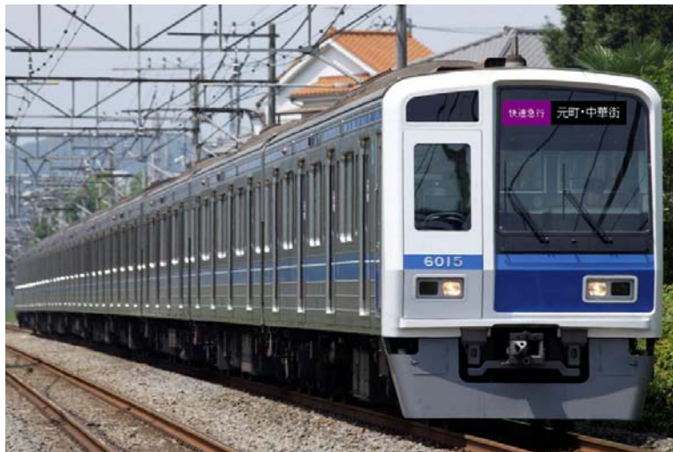
東急東横線・横浜高速みなとみらい線に直通運転する6000系（イメージ）