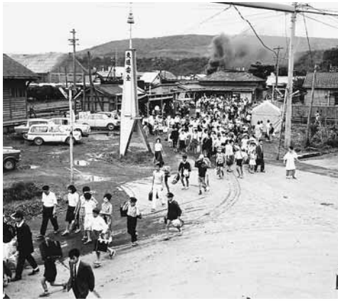
▶昭和30年代後半〜40年代にかけての増毛駅周辺の写真。列車に乗っていたたくさんの乗客が駅から出てくる様子が確認できる。写真中央上部にはS.Lの黒煙が写っている。

「ニシンが大漁になると子どもたちも漁の手伝いをするため、よく学校が休みになった。留萌駅に着いてから知らされるので、また列車に