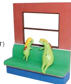
車内に設置する かっぱのイメージ