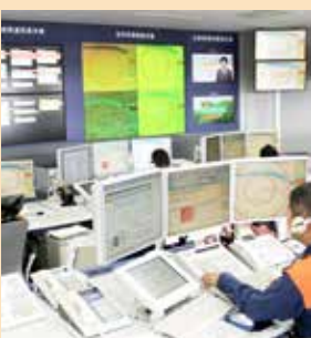
現在の消防支援システム

システムの機器更新を行うことで、119番通報の受信から現場到着までの時間の短縮が可能となります。