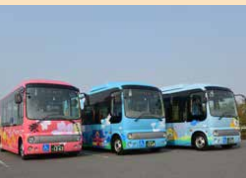
バスロケーションシステムを導入するゆうゆうバス

の待ち時間を減らすことができるほか、渋滞等による遅延や早着も確認できるので、バス待ちの不安やイライラも解消されます。