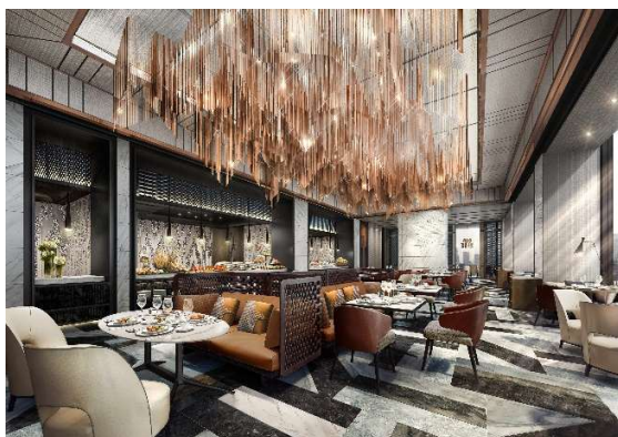
シェフズ・シアターイメージ