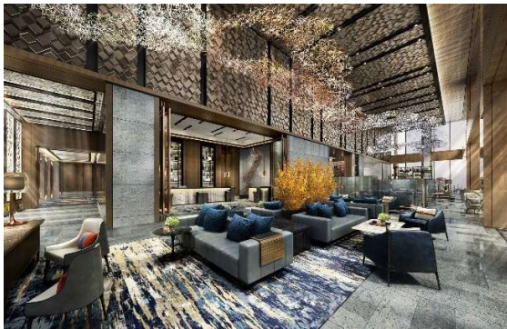
ホテルロビーイメージ