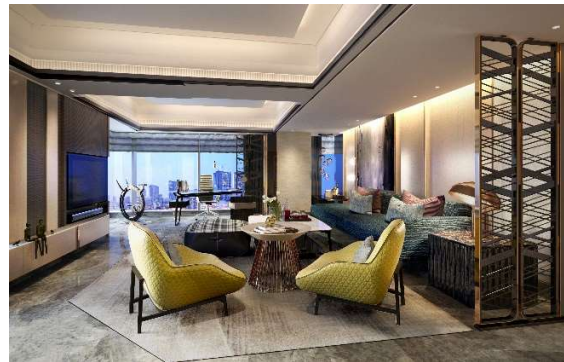
スイートルームイメージ