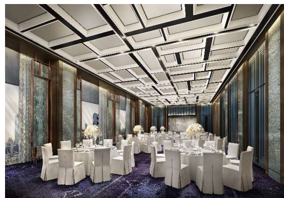
バンケットルームイメージ