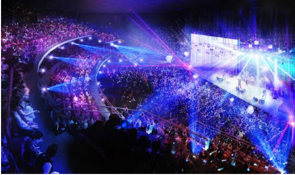
大ホール完成予想パース（今後変更になる可能性があります）

最大7,000人収容の大ホールとライフスタイルホテル、エリアマネジメント施設などの整備を目指してまいります。エリアマネジメントの活動拠点の中心となる施設は、現中野サンプラザの機能を継承しつつ新たな交流機能を加えます。