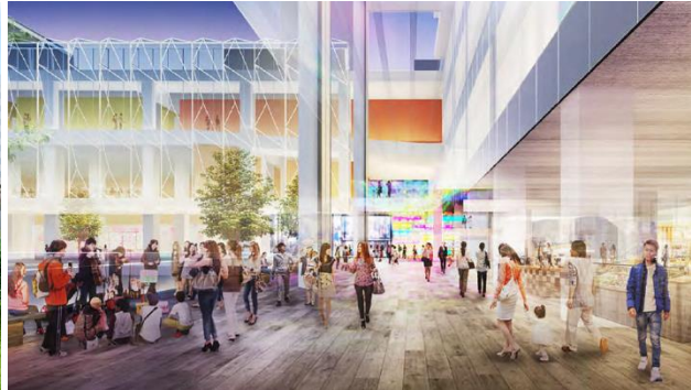
歩行者空間完成予想パース（今後変更になる可能性があります）