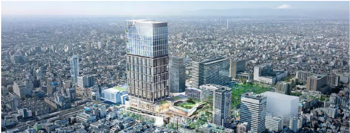
建物完成予想パース（今後変更になる可能性があります）

基壇部は周辺の街並みに合わせたスケールに分節し調和を図り、高層部は中野のシンボルとなっている現中野サンプラザの三角形を活かしたトップデザインとしながら、新たなシンボルタワーとなることを目指します。