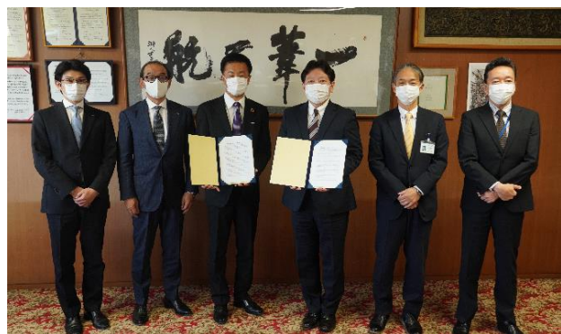
2021年5月6日 基本協定書締結式