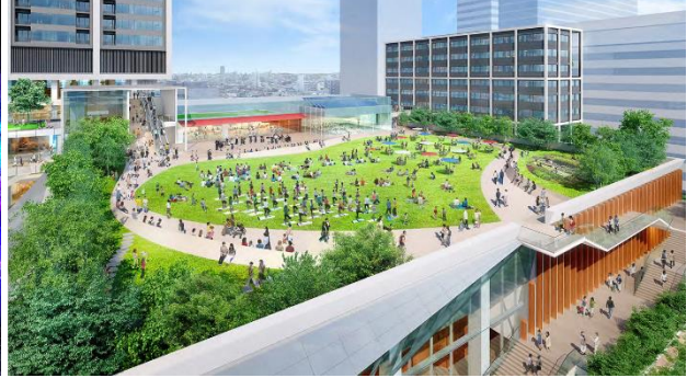
屋上広場完成予想パース（今後変更になる可能性があります）