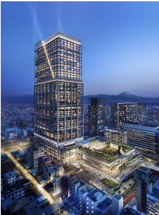
建物完成予想パース（今後変更になる可能性があります）

本事業は、中野駅北口エリアの2ヘクタールを超える大規模な敷地において行われる、ホール・オフィス・住宅・商業・ホテルなどにより構成される複合再開発事業です。音楽、サブカルチャー、食など多様な文化を育ててきた中野駅周辺の回遊性を高めることでさらに賑わいと交流を創出し、立地特性を最大限に活かした拠点施設整備を行うことによって、グローバルな都市活動拠点の形成や地域経済の活性化に寄与していくことが期待されています。また、本事業は同エリアの象徴的な存在である中野サンプラザの機能を再整備する事業でもあることから、文化を原動力としたまちづくりを目指し生活・産業・交流を活性化させるため整備を図ってまいります。