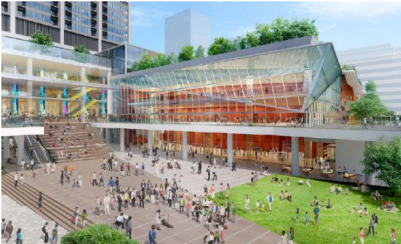
集いの広場完成予想パース（今後変更になる可能性があります）

中野駅西側南北通路・橋上駅舎（駅ビル）の整備や新区役所整備などの関連事業や周辺環境を踏まえ、広場や歩行者空間を整備することで、新たな交流と賑わいを創出します。