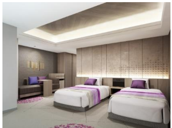
客室デザイン（ツインタイプ）