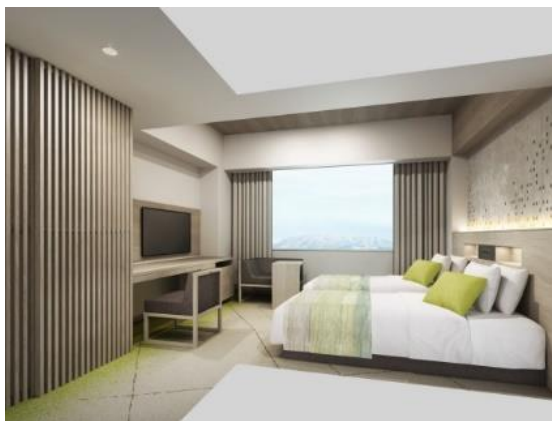
客室デザイン（ハリウッドツインタイプ）