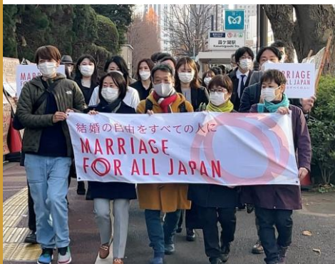
裁判所に入る原告・弁護団