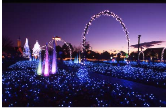
★ 長島ビール園前 「光の雲海」