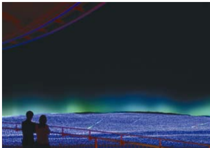
2009 年度 テーマ『オーロラ』