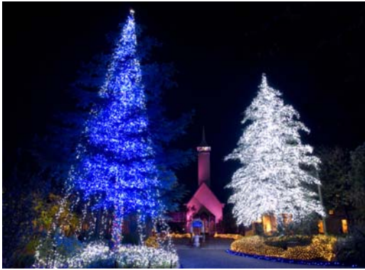
★ チャペル前 ツインツリー