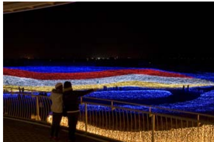
2008 年度 テーマ『花』