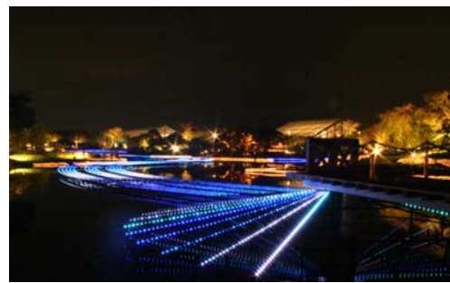
なばなの里ではお馴染みの「水上イルミネーション」(左 チャペル対岸から・右 チャペル側から眺める)