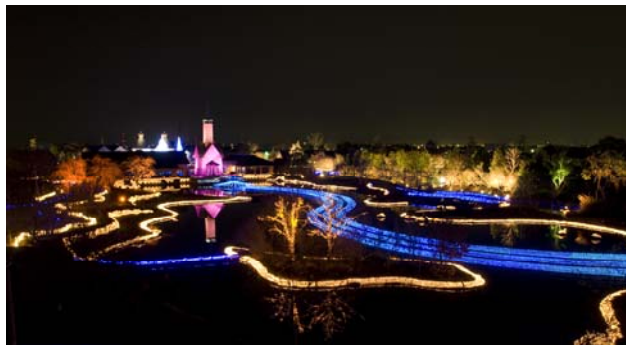
なばなの里 ウィンターイルミネーション