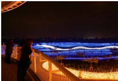
2007 年度 テーマ『銀河』